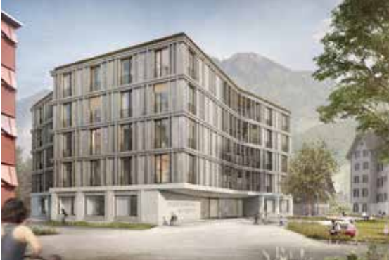
Wohnhaus Mettenweg Weidlistrasse 2b 6370 Stans

Bauherrschaft Gemeinde Stans Architektur BGP Bob Gysin Partner, Zürich Kunst Lea Achermann Vergoldung Stöckli AG Stans